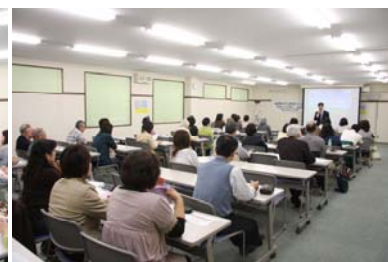
講座の様子 2009. 6. 1