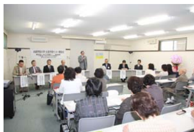
開所式の様子 2009. 6. 1