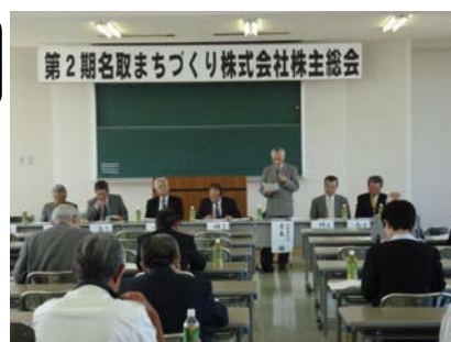
名取まちづくり株式会社の株主総会 2009. 6. 2