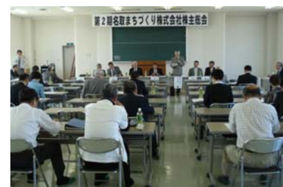
名取まちづくり株式会社の株主総会 2009. 6. 2