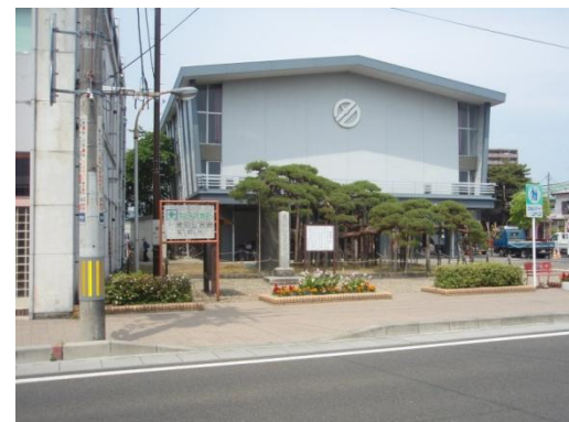
市指定の天然記念物の『衣笠の松』